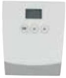
Dekal, el låda