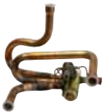
Ventil komplett, fyrvägs